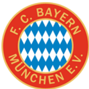
Wappen 1966 – 1967