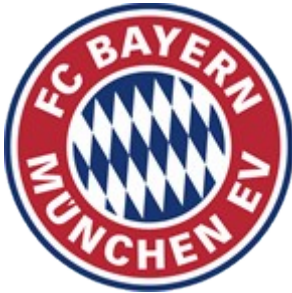
Wappen 1997 – 2004