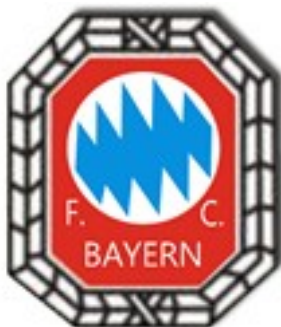
Wappen 1935 - 1936