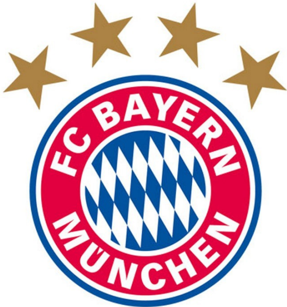
Wappen 2004 bis Heute