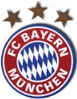
Wappen 2004 – 2008