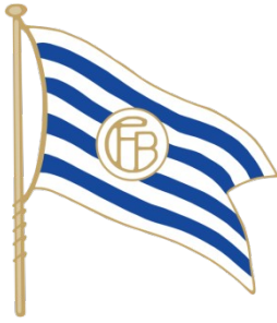
Erstes Wappen des Vereins von 1900 bis 1901